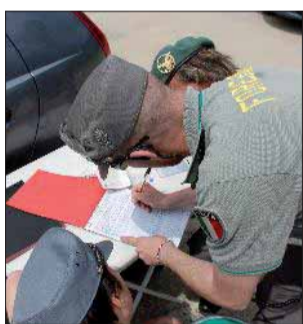
Multe Forestale al lavoro

AREZZO - Il branco avrebbe cercato di violentarla mentre si trovava nella sua camera, nell'appartamento che divide con un connazionale. Proprio quest'ultimo, insieme ad altri due uomini che si sono dati alla fuga, avrebbe cercato di abusare della giovane che è riuscita a mettersi in salvo, scappando via da quella casa. L'uomo, un cinquantenne originario della Romania, è stato arrestato. Ma sull'episodio ci sono molti punti oscuri da chiarire.