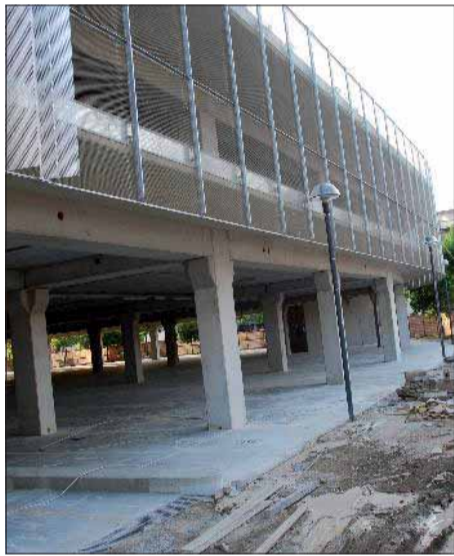
Mecenate Parcheggio in dirittura ▶ A pagina 5

Multipiano pronto per l'inaugurazione Mercato coperto al Park Mecenate