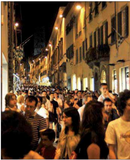
Acquisti fino a mezzanotte Giovedì la prima Notte Bianca ▶ A pagina 3

Negozi aperti giovedì, il 17 e il 22 Le notti bianche dello shopping