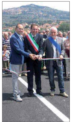
Taglio del nastro Del primo tratto ▶ A pagina 14

Camucia Stanziati altri 8 milioni per la variante alla regionale 71