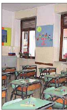
Tagli A scuola